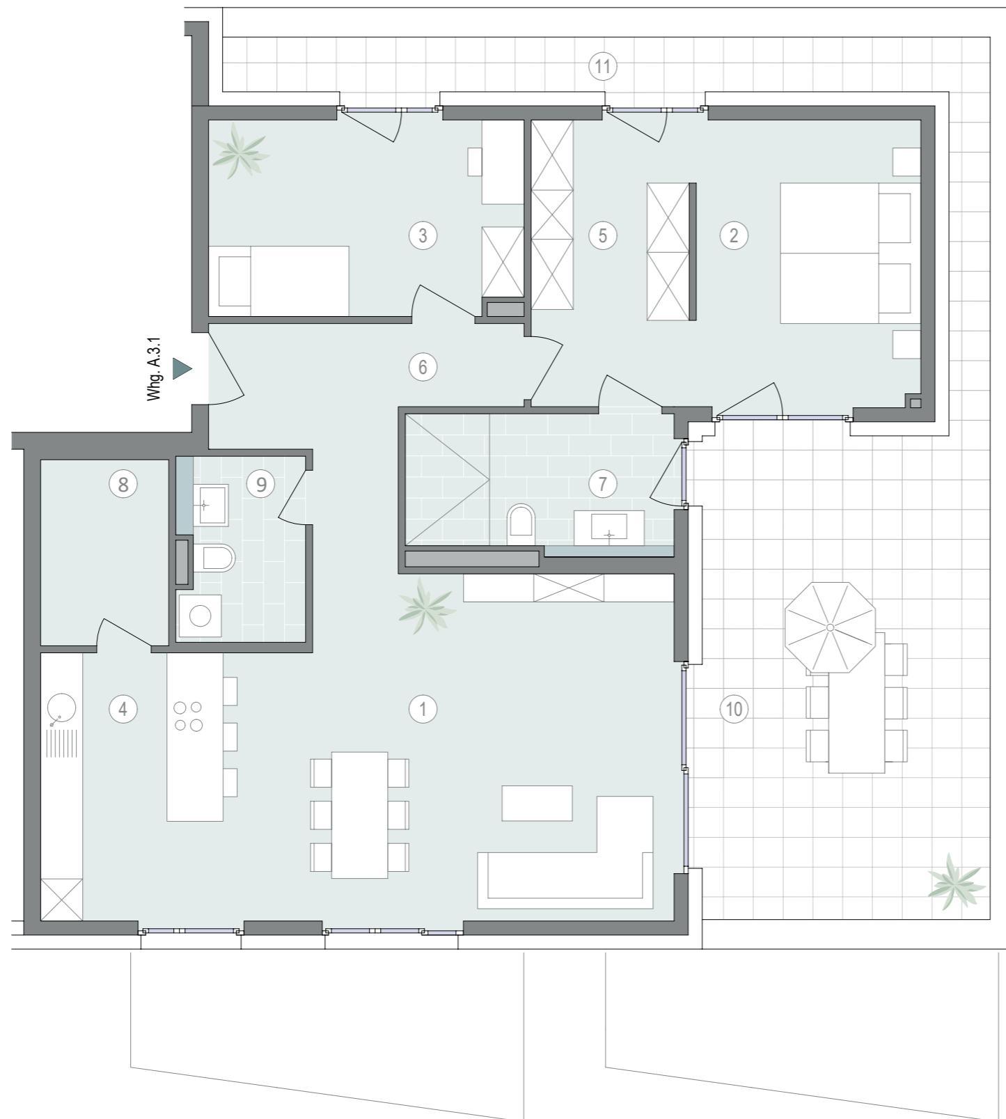
Haus A - Wohnung A.3.1*